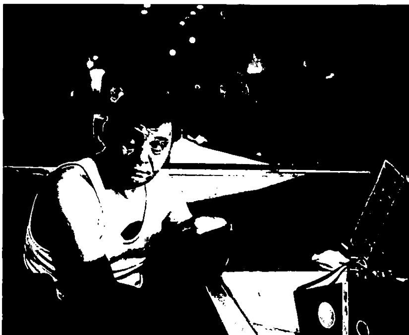
La Raison du plus fou : Le conducteur d'une machine dans la grande papeterie